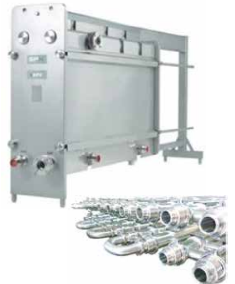
Plakalı ve Borulu Eşanjörler Plate and Tubular Heat Exchangers