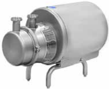
Kendinden Emişli Santrifüj Pompalar Self Priming Centrifugal Pumps