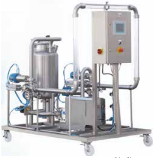
Pig Sistem Pig System