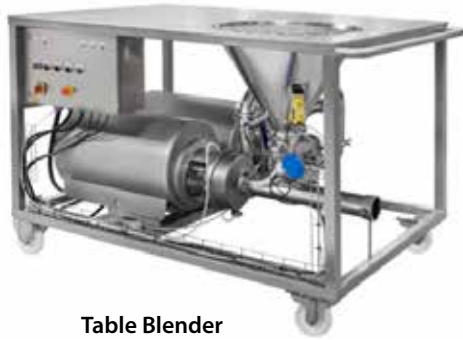
Table Blender Table Blender

Hijyenik solüsyonların dispersiyon, emülsiyon, homojenizasyon proseslerinde kullanılırlar. Sıvı toz karışımların yapılması ve partikül büyüklüklerinin küçültülmesinde görev yaparlar. Standart karıştırıcılara göre %90 oranında işlem zamanını kısaltırlar. Tank üstü dikey, tank altı, pompa tipi (silkülasyon), high shear ve table olarak farklı tipleri mevcuttur. Gıda, kozmetik ve ilaç sektörlerinde homojen karışımlar oluşturmada ideal çözümler sunarlar.