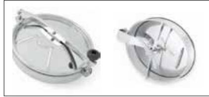
Tank Kapakları Manholes