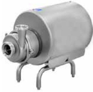
Hyginox Santrifüj Pompalar Hyginox Centrifugal Pumps