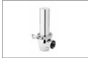
Emniyet Ventili Over Flow Valve