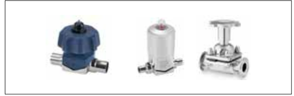
Diyafraam Vanalar Diaphragm Valve