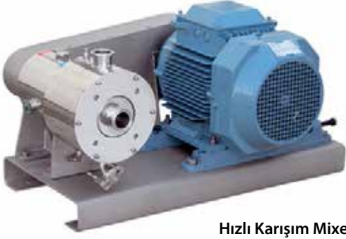
Hızlı Karışım Mixeri High Shear Multitooth Mixer