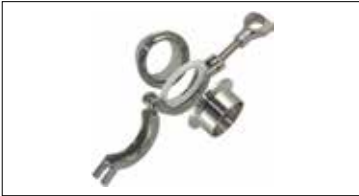
Clamp Bağlantılı Ekipmanlar Clamp Connection Equipment