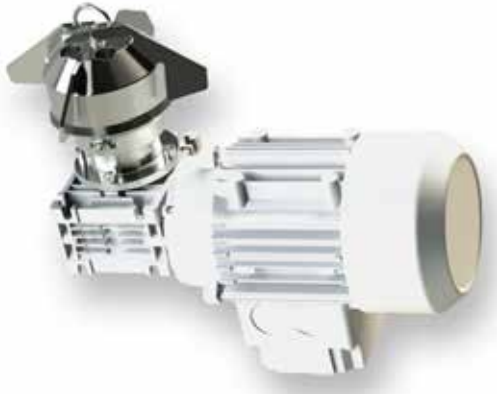
Magnetik Karıştırıcılar Magnetic Agitator