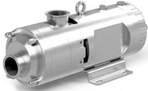
Twin Screw Pompalar Twin Screw Pumps