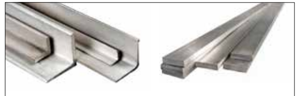
Paslanmaz Çelik Köşebent & Lama Stainless Steel Angle Bar & Flat