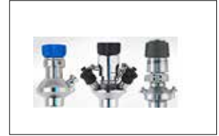
Aseptic Numune Alma Vanaları Aseptic Sampling Valves