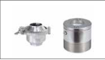
Check Valve Check Valve