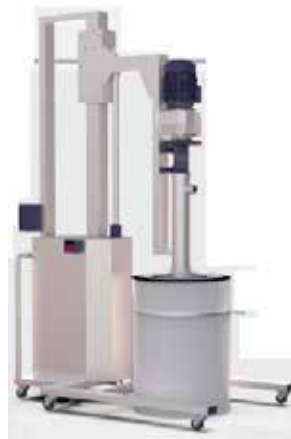
Varil Boşaltma Sistemi Unloading Barrel System