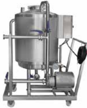
Manuel ve Otomatik CIP Sistemleri Manual and Automatic CIP Systems