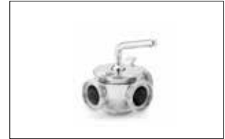
3 Yollu Manuel Vana Three way manual ball valve