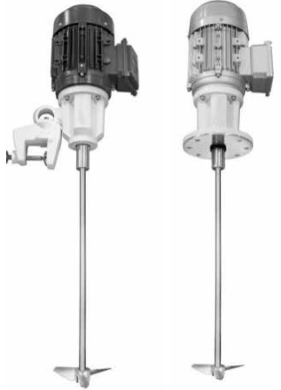
Portatif ve Dikey Karıştırıcılar Portable and Vertical Agitator

Tanklara , yandan , üstten ve magnetic olarak bağlanabilen hijyenik karıştırıcılar , gıda, kozmetik ve ilaç sektörlerinde depolama ve proses işlemlerinde kullanılırlar . Tüm modeller A316 paslanmaz çelikten imal edilmiştir. Süt, yağ, şarap ve ilaç prosesleri için ideal çözümler sunarlar.