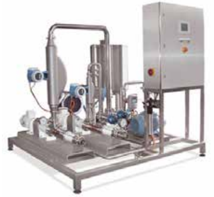
SLES Eritme Sistemi SLES Dilution System