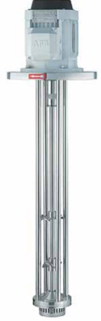
Dikey Mixer Vertical Mixer