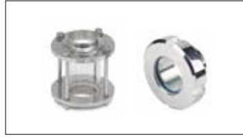
Gözetleme Camları Sight Glasses