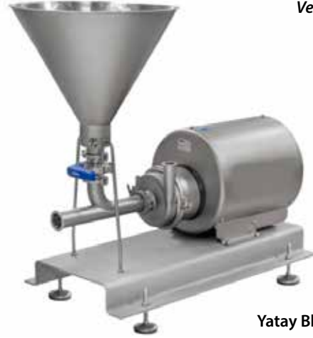
Yatay Blender Horizontol Blender