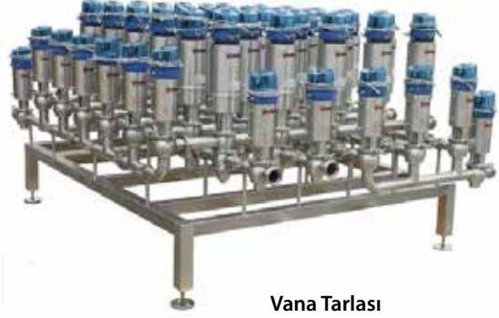
Vana Tarlası Valve Manifold