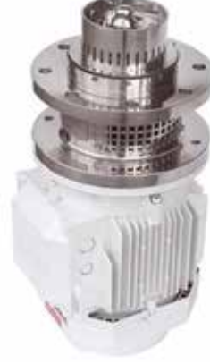
Tank Altı Mixer Tank Bottom Mixer