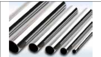
Paslanmaz Çelik Borular Stainless Steel Pipes