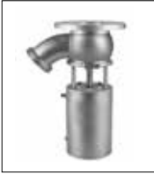
Tank Dip Vanası Tank Bottom Valve