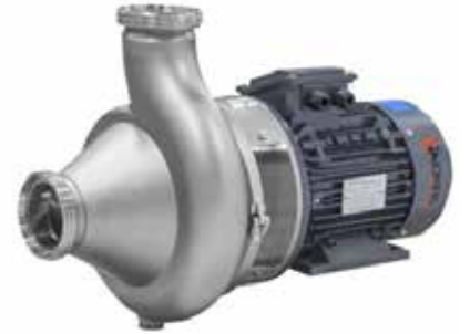
RV Helisel Pervaneli Taneli Ürün Transfer Pompaları RV Helical Propeller Grain Product Transfer Pumps

A316 L kalite paslanmaz çelikten imal edilen santrifüj pompalar, gıda, içecek, ilaç, kozmetik ve benzer sektörlerde kullanılmaktadır. Yüksek et kalınlığı sayesinde korozyon aşınmalarına karşı uzun ömür gösterirler. Kolay sökülebilir özellikleri ile kısa sürede kontrol ve temizlik uygulamalarına olanak sağlarlar.