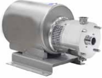
Yatay Mixer In-line Mixer