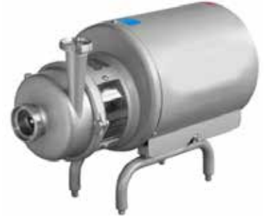
Prolac Yüksek Hijyen Sınıfı Santrifüj Pompalar Prolac High Hygiene Grade Centrifugal Pumps