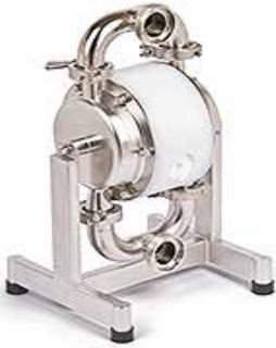
Havalı Diyafram Pompalar Air Diaphragm Pumps