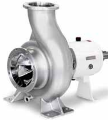
Yüksek Kapasiteli Santrifüj Pompalar High Capacity Centrifugal Pumps