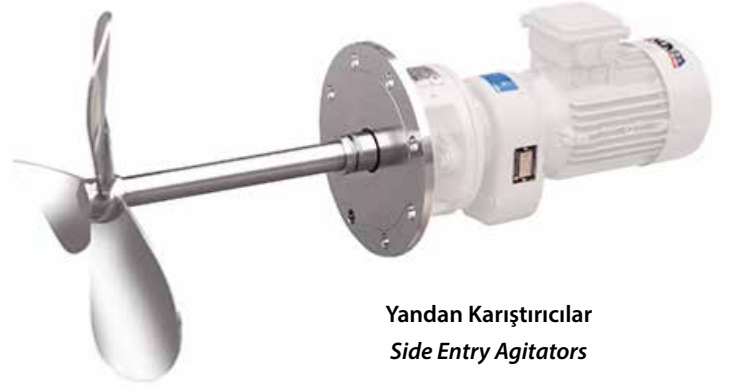
Yandan Karıştırıcılar Side Entry Agitators