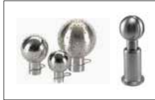
Tank Yıkama Topları Cleaning Spray Balls