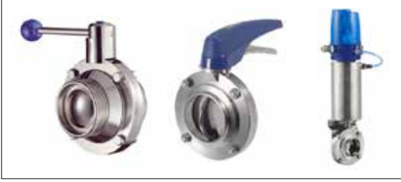
Manuel ve Pnömatik Kelebek Küresel Vanalar Ball- Butterfly Valves – Manual and Pneumatic Drives