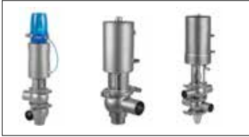
Hava Kumandalı Çift ve Tek Yataklı Vanalar Innova Double and Single Seat Valve