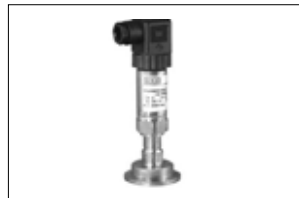
Basınç Transmitter Pressure Transmitter