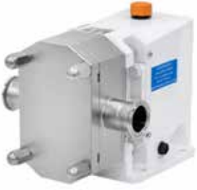
SLR-HLR Lobe Pompalar SLR-HLR Lobe Pumps