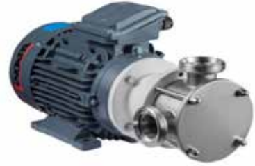
Esnek Pervaneli Pompalar Flexible Impeller Pumps

Viskoz ürünlerin ve katı partikül içeren karışımların transferinde kullanılan , pozitif deplasmanlı pompalar ; ürünleri yormadan ve yapılarını bozmadan transfer edebilirler. Salmastra yıkama , ısıtma ceketi , By-pass, opsiyonları ile zorlu proseslerde ideal çözümler sunarlar. Ayrıca yatay, dikey ve hazneli bağlantı opsiyonları da bulunmaktadır. Ürünle temas eden tüm metal kısımlar A316 paslanmaz çelik malzemeden imal edilmiştir. Kauçuk kısımlar ise FDA onaylı Nbr , Epdm veya PTFE malzemelerden yapılmıştır. Seçilen modele göre emme, debi ayarı, yüksek tane boyutu taşıma gibi özelliklere sahiptir .