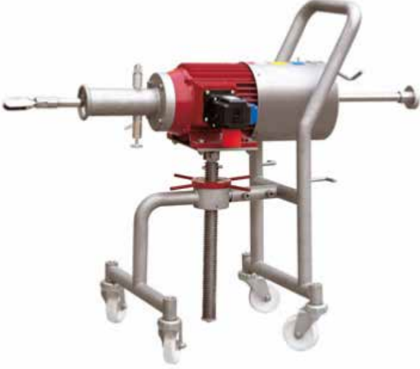
Seyyar Karıştırıcılar Itinerant Agitator